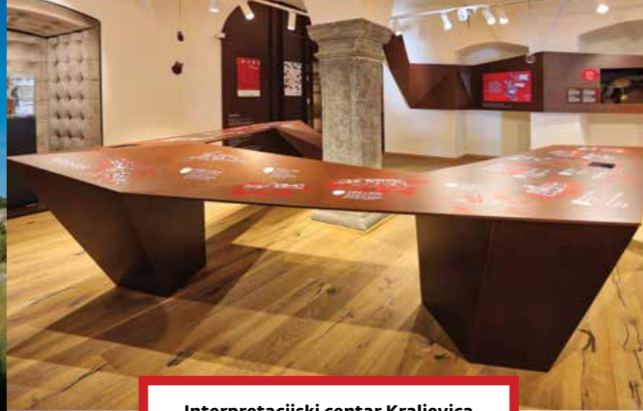
Interpretacijski centar Kraljevica

I resti dell'antica città medievale di Hreljin, dei Frankopan, si trova su una ripida salita che si innalza sul mare. In passato, Hreljin fu un importante centro abitato, commerciale, difensivo e amministrativo, situato in un punto strategico dal quale era possibile monitorare i collegamenti tra i territori montani del Gorski kotar e il mare. I Frankopan lo ottennero in dono dal re ungaro-croato Andrea II, insieme ai resti della contea di Vinodol.